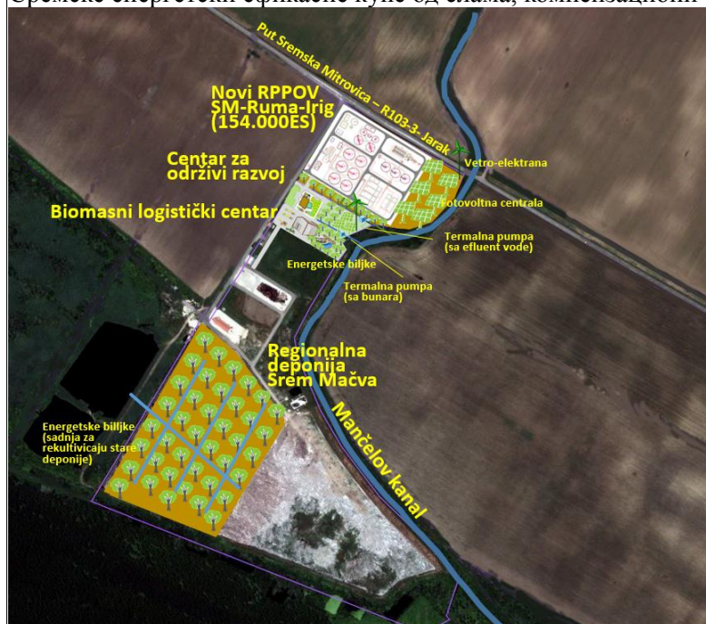
Скица 1: Просторна и функционална повезаност Центра за одрживи развој и РППОВ СМ-Рума-Ириг

Скица 1 дефинише ову функционалну повезаност и наводи се, не као обавезујућа за Пројектанта, већ као приказ концепта и међусобних веза (првенствено просторних) са једним могућим решењем РППОВ и Центра. Скица садржи и неке функционалне целине које су везане за оперативни рад Центра (на пример, засади енергетских биљака, показне инсталације разних система коришћења обновљивих извора енергије, као и делове партерног уређења које садрже посебне садржаје – експлоатационо / испитни објекти бунгалова типа Сремске енергетски ефикасне куће од слама, компензациони базен соларне припреме топле воде и други.