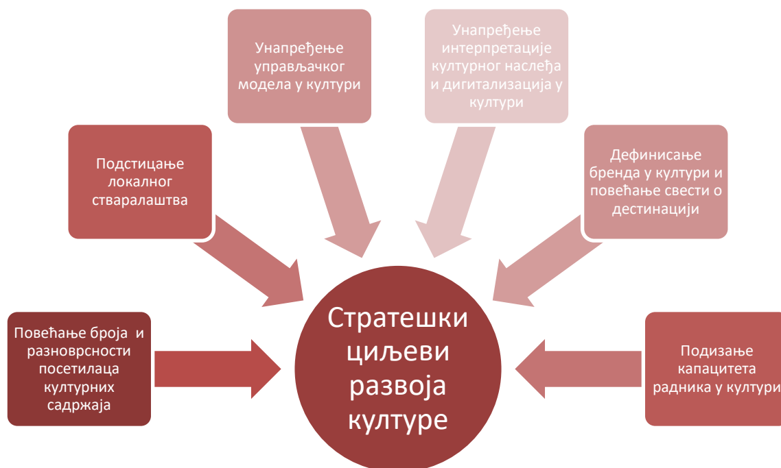
Шема 4. Стратешки циљеви развоја културе Града Сремска Митровица