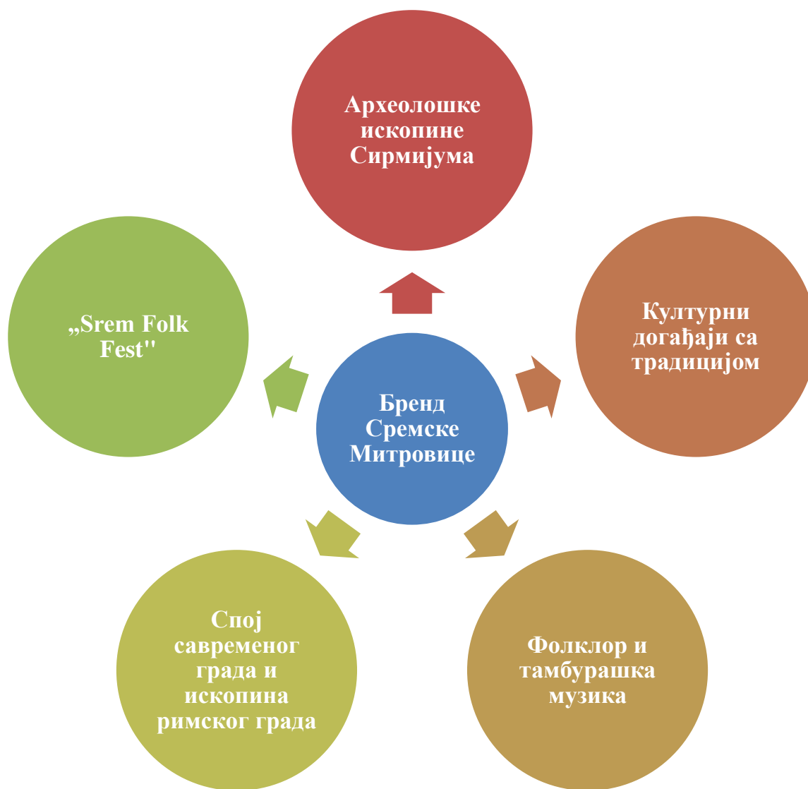
Шема 2. Бренд Града Сремска Митровица у области културе

Последње питање односило се на то по чему је Град Сремска Митровица другачији/специфичан када је култура у питању, у односу на остале градове. Одговори су приказани на шеми 3.